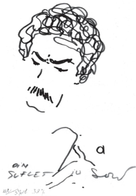
Dumitru Matcovschi în viziunea poetului Marin Sorescu

Următorul vad avea să fie popasul viitorului scriitor la Chișinău, la studii. Intră la facultatea de Filologie a Institutului Pedagogic „Ion Creangă”. Acesta se comasează provizoriu cu Universitatea de Stat, astfel că în 1961 tânărul poet termină facultatea